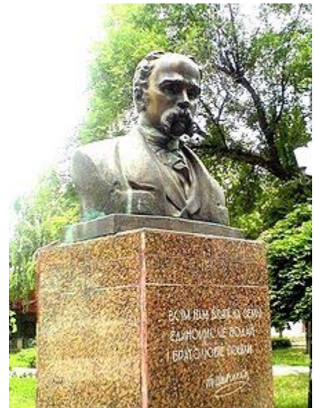
Пам'ятник у Бельцях

Деяке полегшення становища Шевченка настало з весни 1848 року внаслідок включення його штатним художником до складу Аральської експедиції під командуванням лейтенанта Бутакова. Перебування на о. Кос-Арал було дуже продуктивним у його творчості. Крім виконання численних малюнків, сепій та акварелей, Шевченко написав поеми «Царі», «Титарівна», «Марина», «Сотник» і понад 70 поезій, у яких відбито важкі переживання, спричинені неволею та самотністю. В Оренбурзі Шевченко зблизився з засланцями-поляками, учасниками повстання 1830–1831 років, і заприятелював з польським істориком Бр. Залеським, з яким пізніше листувався. У квітні 1850 року Шевченка вдруге заарештовано і після піврічного ув'язнення запроторено в Новопетровський береговий форт, на півострів Мангишлак.