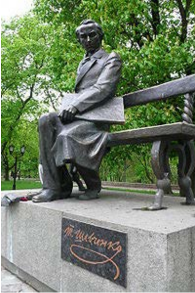
Пам'ятник Т.Г. Шевченку в Чернігові

Навесні 1846 року Шевченко прибув до Києва, оселився в будинку (тепер — Літературно-меморіальний будинок-музей Тараса Шевченка) у колишньому провулку «Козине болото». У цей час були написані балади «Лілея» та «Русалка». У квітні Тарас пристав до Кирило-Мефодіївського братства, таємної політичної організації, заснованої з ініціативи Миколи Костомарова. 9 грудня 1846 року Шевченко подає заяву на ім'я попечителя Київського навчального округу про зарахування на посаду вчителя малювання в Київському університеті Святого Володимира, на яку його затвердили 5 березня 1847 року. У березні 1847 року, після доносу, почалися арешти членів братства. Шевченка заарештували 17 квітня 1847 року на дніпровській переправі, коли він повертався до Києва, відібрали збірку «Три літа» і відправили під конвоєм до Петербурга, ув'язнили в казематі Третього відділу імператорської канцелярії на Пантелеймонівській