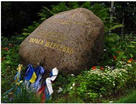
Могила на Смоленському цвинтарі Санкт-Петербурга

в пошуках історичних сюжетів мав намір звернутися до П. Буткова. Про це поет писав у листі до Осипа Бодяньського 11 липня 1844 року. 11 листопада 1844 року комітет Товариства заохочення художників ухвалив надати Шевченкові грошову допомогу для видання «Живописной Украины», виділивши для цієї мети 300 крб та зобов'язавши його надіслати для Товариства один примірник першого випуску видання. Перші 6 офортів серії («У Києві», «Видубецький монастир у Києві», «Судня рада», «Старости», «Казка» («Солдат і Смерть»), «Дари в Чигрині 1649 року») вийшли друком у листопаді того ж року під назвою «Чигиринський Кобзар». 1844 року