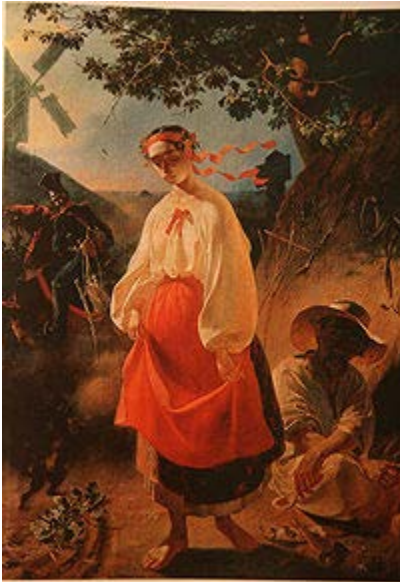
Катерина (олія, 1842)