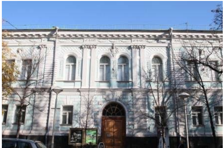
Національний музей Тараса Шевченка

поема «Марія» становить вершину творчості поета після заслання. Шість раніше написаних і заборонених у Росії поезій Шевченка видано за кордоном у Лейпцігу, у 1859 році. У друкарні П. Куліша 1860 року побачило світ нове видання «Кобзаря», яке, однак, охоплювало тільки незначну частину поезій Шевченка. Того ж року надруковано й «Кобзар» у перекладі російських поетів, а у січні 1861 року випущено окремою книжкою Шевченків «Буквар», посібник для навчання в недільних школах України, виданий коштом автора та накладом 10 тис. примірників.