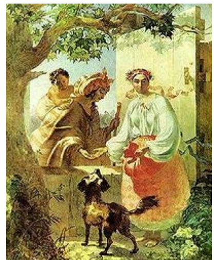
«Циганка ворожить українській дівчині»

У повісті «Художник» Шевченко розповідає, що в доакадемічний період він намалював такі картини: «Аполлон Бельведерський», «Фракліт», «Геракліт», «Архітектурні барельєфи», «Маска Фортувати». Шевченко бере участь у розписі Великого театру як підмайстер-рисувальник. Виконав композицію «Олександр Македонський виявляє довір'я своєму лікареві Філіппу» (акварель, туш, перо). Дата і підпис Шевченка. Малюнок виконано на тему, оголошену ще 1830 року для конкурсу в Академії художеств на одержання золотої медалі.