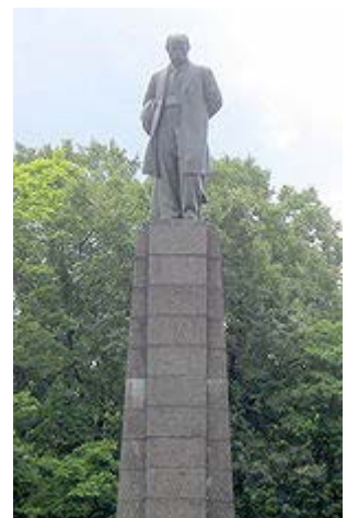
Пам'ятник на могилі Тараса Шевченка

Через яскраво антирежимний характер нові поетичні твори Шевченка не могли бути надруковані й тому розповсюджувались серед народу в рукописних списках. Сам Шевченко переписав їх для себе в спеціальний зошит-альбом, якому дав назву «Три літа» (1843–1845).