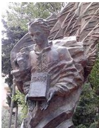
Молодий Тарас Шевченко з книгою «Кобзар» (пам'ятник у Баку)

час так званої Каратауської експедиції, улітку 1851 року, він виконав біля 100 малюнків аквареллю й олівцем, зокрема «Вид на гори Актау з долини Агаспеяр», «Гора в долині Агаспеяр», «Гори в долині Агаспеяр», «Кладовище Агаспеяр»). Знайшовши коло форту добру глину й алебастр, Шевченко почав вправи в скульптурі. Серед виконаних ним скульптурних творів були й 2 барельєфи на новозавітні теми: «Христос у терновому вінку» і «Йоан Хреститель». Поет тоді почав писати російською мовою повісті з українською тематикою та багатим автобіографічним матеріалом («Наймичка», «Варнак», «Княгиня», «Музыкант», «Художник», «Несчастный», «Близнецы» та інші).