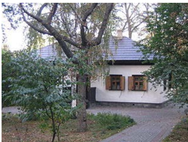
Хата на Пріорці

Навесні 1858 року поет прибув до Петербурга, де його тепло зустріли українські друзі та численні прихильники, серед них і родина Федора Толстого. У червні того ж року Шевченко оселився в Академії мистецтв, де жив до самої смерті. Щоб познайомитися з українським поетом, туди приїжджали І. Тургенєв і Марко Вовчок.