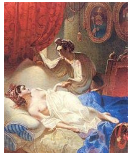
«Марія» (ілюстрація до поеми О.С. Пушкіна «Полтава», 1840)

Улітку 1842 року, використавши сюжет поеми «Катерина», Шевченко намалював олійними фарбами однойменну картину, яка стала одним із найпопулярніших творів українського живопису.