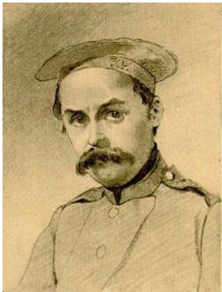
«У солдатах». Автопортрет, 1847 рік

Улітку 1836 року, під час одного з нічних рисувальних «сеансів» у Літньому саду, він познайомився зі своїм земляком — художником І. Сошенком, а через нього — із Євгеном Гребінкою, В. Григоровичем і О. Венеціановим, які познайомили його з впливовим при дворі поетом В. А. Жуковським. Сошенко умовив Ширяєва відпустити Шевченка на місяць з ним, щоб цей час він використав для відвідування зали живопису Товариства заохочення художників і комітет цього товариства, «розглянувши рисунки стороннього учня Шевченка», ухвалив «мати його на увазі на майбутнє».