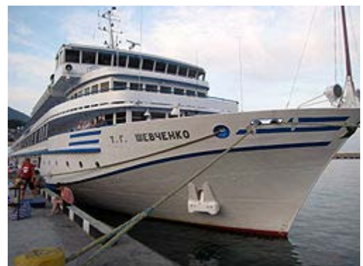
Катер «Т.Г. Шевченко»