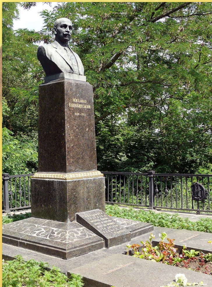
Чернігів. Болдина гора

Михайло Коцюбинський хворів астмою і туберкульозом. Навесні 1913 року Михайла Михайловича не стало. Поховали письменника на Болдиній горі у Чернігові, улюбленому місці його щоденних прогулянок. Михайло Коцюбинський прожив 48 років.