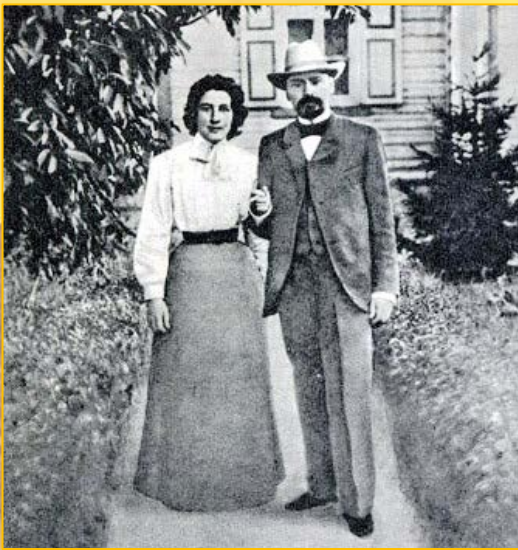
М. Коцюбинський з дружиною