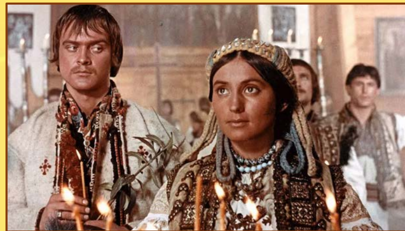
Кадр з фільму «Тіні забутих предків» (1965 р.)