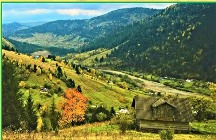
с. Криворівня Івано-Франківська область

Улітку 1910 року, повертаючись з-за кордону, Михайло Коцюбинський заїхав у карпатське село Криворівню. Враження, які охопили від знайомства з побутом, людьми, мовою, традиціями цієї землі, заворожили його. Згодом він ще двічі приїздить у цей край, а свої враження він змальовує чудовим твором «Тіні забутих предків» (1911). Ця геніальна повість-притча вчить людей найскладнішій науці - життю, життю за законами краси, вірності, духовності.