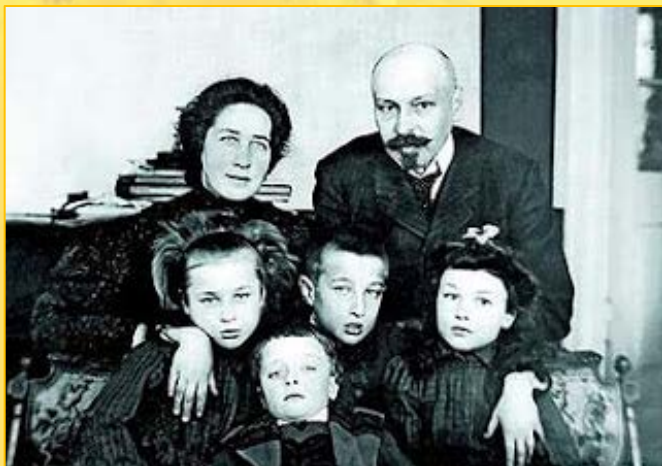
М. Коцюбинський з дружиною та дітьми

Літературна кар'єра Михайла почалася з повного провалу. У 1884 р. він написав оповідання «Андрій Соловко, або Вченіє світ, а невченіє тьма». Цю першу спробу молодого автора було оцінено вельми скептично. Після цього він кілька років не робив нових спроб.